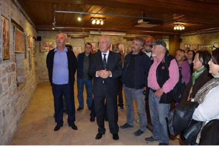
Kuşadası İbrahimaki Sanat Galerisi Fotoğraf Sergisi