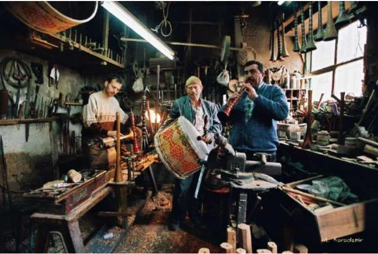
Tokat/Merkez zurna yapımcısı