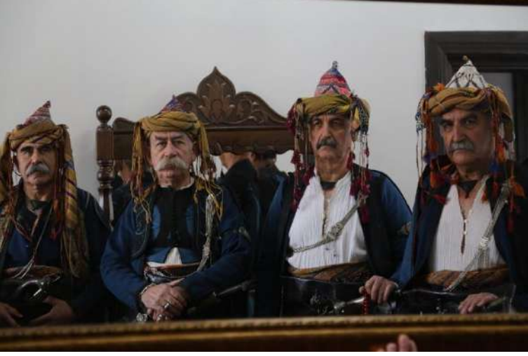
Kütahya Zeybek Alayı