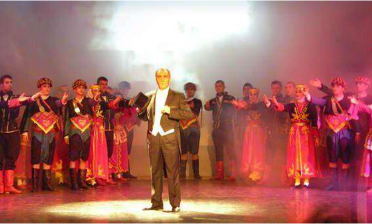
Atatürk ile Yeniden Doğuş Gösterisi