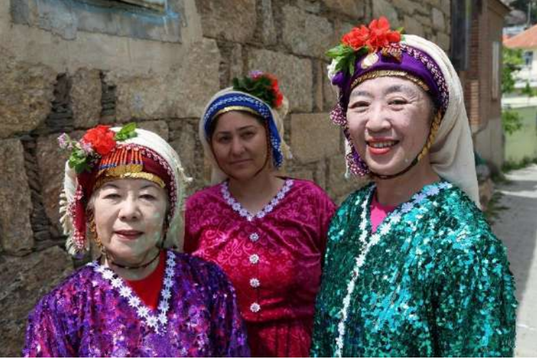
Japon arařtırmacılarla birlikte yapılan Muğla/Milas-Çomakdağ Köyü arařtırması