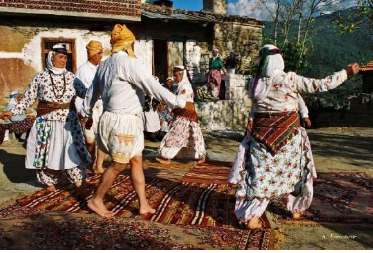
Aydın/Çine-Dutluoluk Köyü tahtacıları