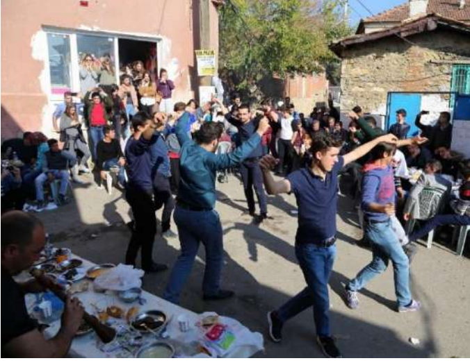
2015-2016 öğretim dönemi öğrencileriyle Aydın/Germencik-Dağyeni Köyü düğün gelenekleri araştırması