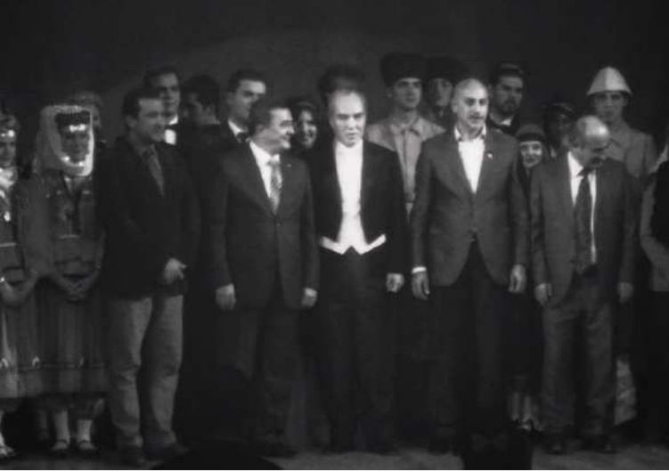
Sarı Zeybek Gösterisi, (Narlidere Belediyesi Arşivi)

Türk halk danslarını yaşatarak gelecek nesillere taşıma amacını başarıyla yerine getirmiştir 26 .