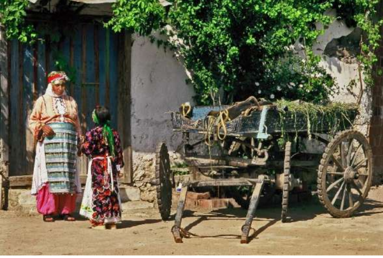
Kazdağları Hacıasanlar Köyü Hidrellez geleneği

Karademir'in bu çalışmaları, Anadolu'nun hemen hemen her bölgesine özgü kültürel unsurların titizlikle belgelenmesi ve saklanması yönünde önemli bir kültürel miras oluşturmuştur.