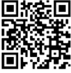
(Red Bull Anadolu Break)