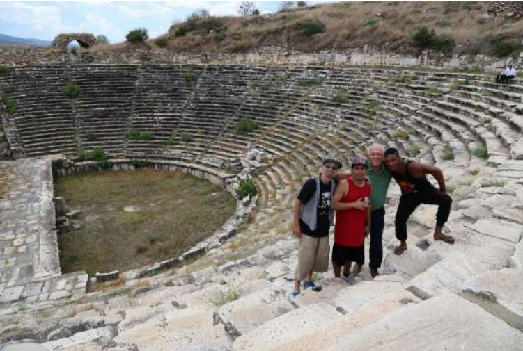
Aydın/Geyre-Karacasu Aphrodisias antik kenti