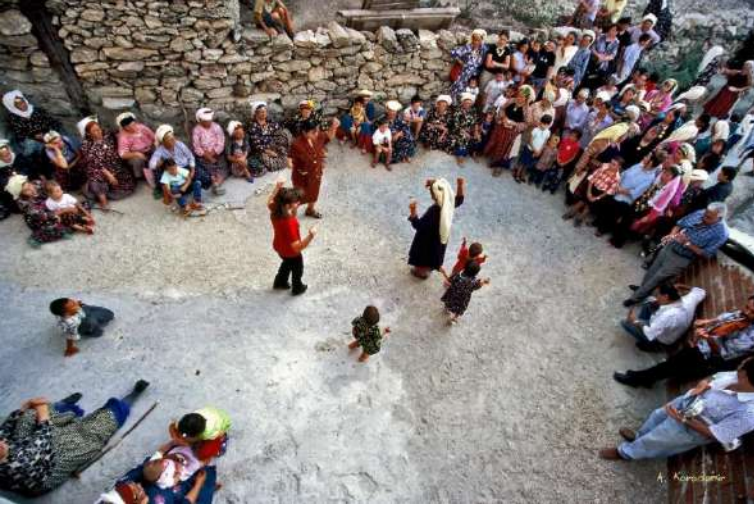
Muğla/Milas-Çomakdağ-Kızıllağaç Köyü düğün geleneği