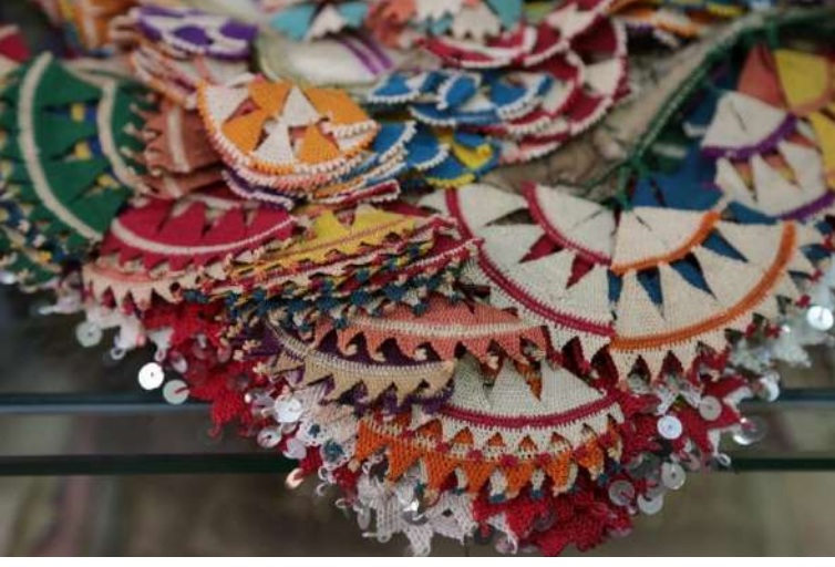
Aydın/Koçarlı-Beşparmak Dağı Damat Oyalari