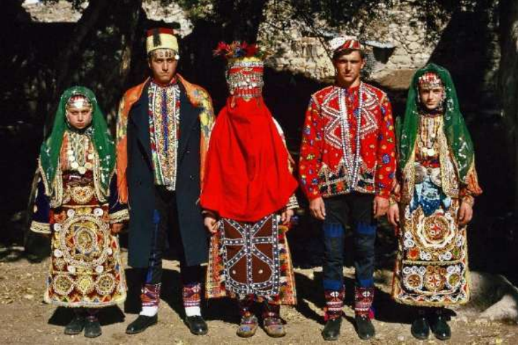
Sivas/Zara-Karacahisar Köyü gelin ve damat geleneksel giyim-kuşamı