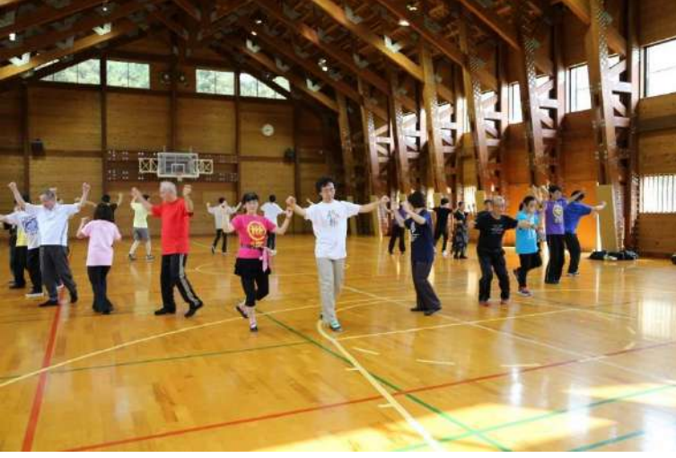
Japonya Ulusal Halk Dansları Federasyonu ile Yürütülen Çalışmalar