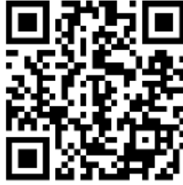
Rapsodi Çorap Müzesi