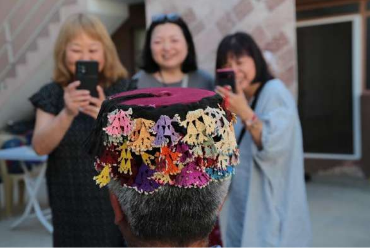
Japon oya arařtırmacıları ile birlikte Aydın/Germencik-Dağyeni Köyü