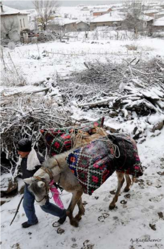
Balıkesir/Dursunbey Sağırlar Köyü Gelin çeyizi taşıma

Karademir'in 1980'de Finlandiya Kaustinen Folk Music Festivali'nde etnografik malzeme ve fotoğraf sergisi ile Fransa Fameck'te açtığı fotoğraf sergisi de Anadolu kültürünün yurtdışında tanıtımına dair çalışmalarındandır. Kültür Bakanlığı Halk Kültürlerini Araştırma ve Geliştirme Genel Müdürlüğünün Almanya'da açtığı sergiye, Karademir'in malzemelerinin götürülmesi ve bu malzemelerden katalog niteliğinde kitap oluşturulması destek verdiği diğer bir sergi faaliyetlerindedir.