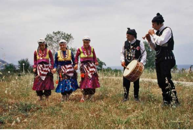
Trabzon/Merkez Horon araştırması