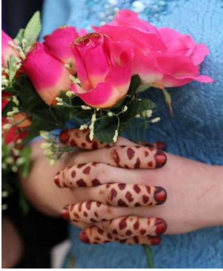
Aydın/Germencik-Dağyeni Köyü Çitme Kına