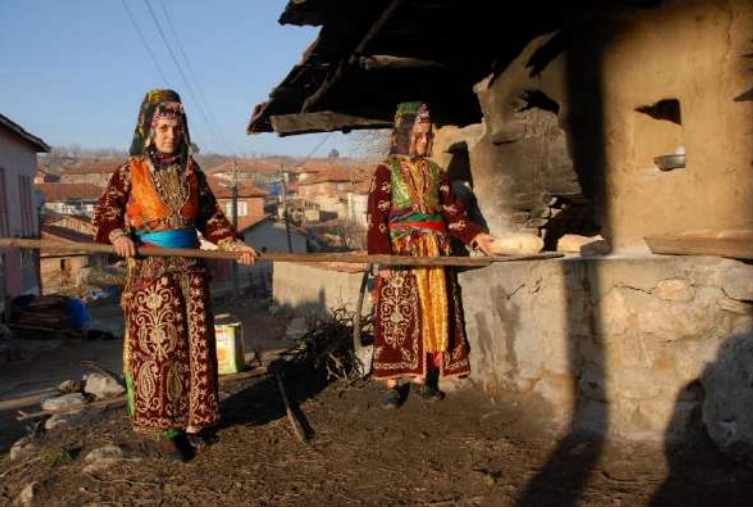
Bursa/Keles-Kıranışıklar Köyü araştırması