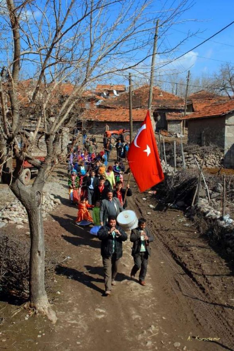
Balıkesir/Dursunbey-Sağırlar Köyü Gelin Göçürme