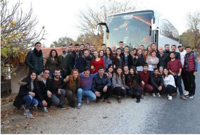
2015-2016 öğretim dönemi öğrencileriyle Aydın/Germencik-Dağyeni Köyü Araştırması