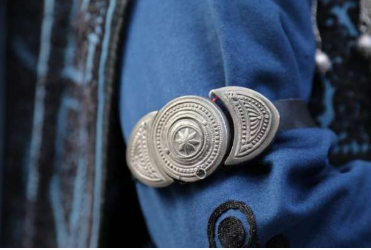
Kütahya Zeybek Alayı aksesuarlarından Pazubend