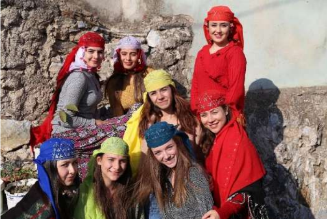
Öğrencilerle Aydın/Germencik-Dağyeni Köyü kadın giyimi araştırması

Sivil toplum kuruluşlarında edindiği deneyimi akademik hayatına taşıyan Karademir, alana yönelik bilimsel yaklaşımını saha çalışmalarıyla birleştirerek, geleneksel dansların bilimsel yöntemlerle