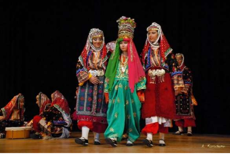
Balıkesir/Dursunbey-Sağırlar Köyü gelin havası

Bu danslar, tarihsel ve kültürel olarak köklü bir geçmişe sahip olup, gösteriye özgü bir biçimde yeniden tasarlanmıştır.