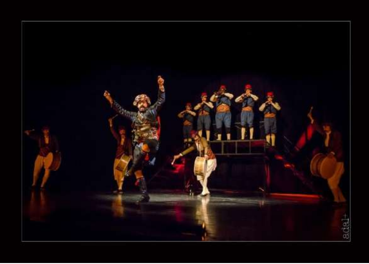
Demirci Mehmet Efe sahnesi

Dansçılar: Türk Halk Oyunları Bölümü Öğrencileri